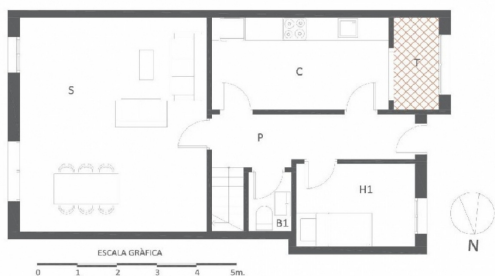
Casa en Calle Cuba. Planta primera San Martín de la Vega, Madrid.

Plano orientativo, no constituye documento constructivo. Mobiliario indicativo de posible distribución