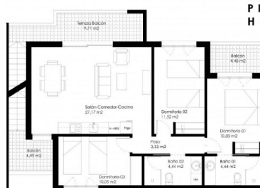
Planta primera_Escala: 1/100